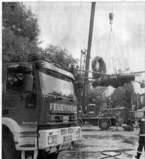
Mit dem Schwerlastkran wurden die Wasserspiele aus dem Fluss gehoben. Bei der Reinigung unterstützte die Freiwillige Feuerwehr Regen die Mannschaft des THW.

Großaktion des THW für die Flussbühne – Eine Fontäne des Pichelsteinerfests bleibt im Fluss