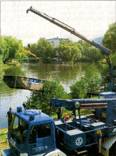
Am Samstag ließ das THW die Pontons für die Flussbühne aufs Wasser schweben.